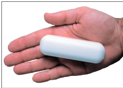
Abb. 1 Ca-PILL®, „biologische“ Kalziumpille

Die Befunde wurden zunächst mit Hilfe des natürlichen Logarithmus umgeformt, um sie einer Normalverteilung anzunähern. Die Beschreibung der Befunde (deskriptive Statistik) erfolgte durch geometrische Mittelwerte und Standardfehler (8) für Fall- und Kontrollgruppe. Danach wurde mittels Varianzanalyse (9) geprüft, inwiefern sich Fall- und Kontrollgruppe unterschieden (induktive Statis-